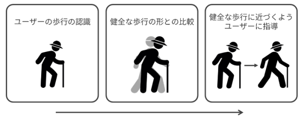
図 1 システム全体の流れ

本稿ではユーザの脚部に装着したカメラ端末の 3 次元位置・姿勢を推定することによりユーザの歩行運動を認識するシステムを提案する。近年、社会の高齢化に伴い高齢者の健康な生活をサポートする様々なリハビリテーション技術が注目されている。高齢者の介護が必要になる原因に転倒による骨折や関節疾患などが挙げられるが、これらは加齢による身体機能の悪化や歩行能力の低下によるものであることが多い。高齢者にとって歩行能力の低下を防ぐための歩行トレーニングは、健康状態の維持や QOL (生活の質) の向上のために必要不可欠である。しかし適切な歩行トレーニングを行うためには専門医による指導やトレーニング施設などの特別な環境が必要である。そこで本研究では、特別な環境を必要としない歩行トレーニング支援システムの開発を目指す。システム全体の大まかな処理の流れを図 1 に示す。本研究ではユーザの歩行運動を認識するために、ユーザの脚の各部位にカメラ端末を装着し、Visual SLAM によりそれぞれのカメラで撮影されるカメラ画像からカメラ端末の自己位置・姿勢を推定する。なお、本稿ではユーザの歩行運動の認識手法について主に述べる。