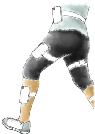
図 2 システムの装着イメージ Figure 2 Installation image of the system

本研究ではシステムが要求するハードウェア要件を比較的容易に実現可能であるという理由から、ユーザの歩行運動の認識を行うための端末に Android スマートフォン (ASUS ZenFone2 ZE551ML) を使用する。このスマートフォンは最大 1,920×1,080 (Full HD) の解像度の動画を撮影することが可能で、加速度センサや地磁気センサ、ジャイロセンサを搭載している。脚の各部位に装着された各々のスマートフォンのカメラにより撮影されるカメラ画像からスマートフォンの 3 次元位置と姿勢を推定することでユーザの歩行運動を認識する。提案するシステムの装着イメージを図 2 に示す