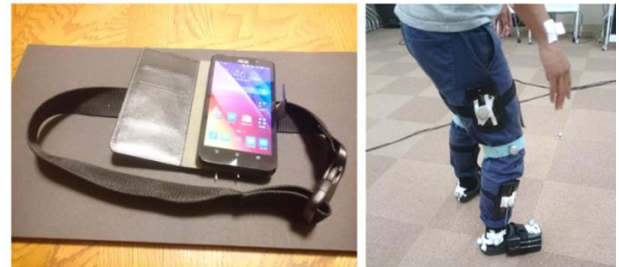
図 3 計測ユニットとその装着例 Figure 3 Measuring unit and its installation example

フリップカバーで構成される。ベルト部に取り付けたアジャスタによりユーザの脚の直径や装着部位によってベルトの長さを調整可能である。スマートフォンと装着ベルトにより構成されるユニットを以下では「計測ユニット」と呼ぶ。計測ユニットとその装着例を図 3 に示す。