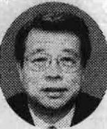
経済同友会 代表幹事 牛友

はなせか。住専の破たんを招いたのは金融機関がパルに踊り、不良債権が首が回らなくなったためだ。末野興産など悪質な借手がカネを返さないのに、九六年度予算では六千八百五十億円もの税金をつぎ込んだ。政府は税金投入を金融システム安定化のためと説明した 大蔵省の反応は、住専処理で税金投入を余儀なくされたのは大蔵省の金融行政が原因だと批判されただけに、今回はこちらから公的資金の導入など言いつける状況ではない」としている。